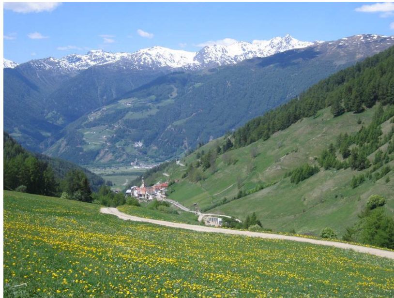
Im Bild: Blick nach Westen, mit aktuellem Bild des Dorfes. Gut erkennbar sind die extensiven Magerwiesenflächen in der rechten Bildseite und die intensiv genutzten Flächen entlang des Feldweges links unten im Bild.