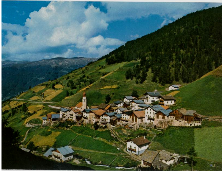
Im Bild: Postkarte Planeil bei Mals im Vinschgau

Das Projektgebiet liegt im nach Westen geöffneten kleinen Seitental nördlich von Mals. Das Tal ist als Hochtal (1.600 – ca. 1.900m) zu bezeichnen, liegt es doch hinter dem kleinen, vom rätoromanischen Baustil geprägten und als Haufendorf errichteten Planeil (1.600m), eine Fraktion der Gemeinde Mals.